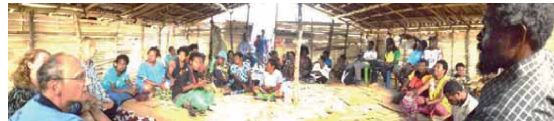
Gruppenfoto während des Besuchs einer Delegation aus dem Dekanat Schwabach in Menyamya 2015)

Anmeldung erbeten bis 26. Juni 2017: E-Mail: dekanat.schwabach@elkb.de