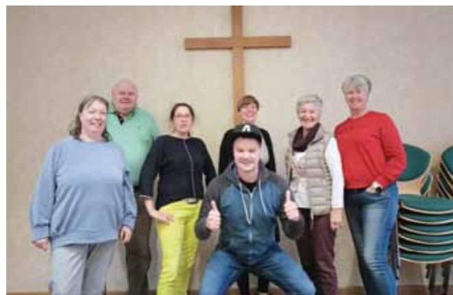
Der Kirchenvorstand nach seiner Klausur-Sitzung am 24. September