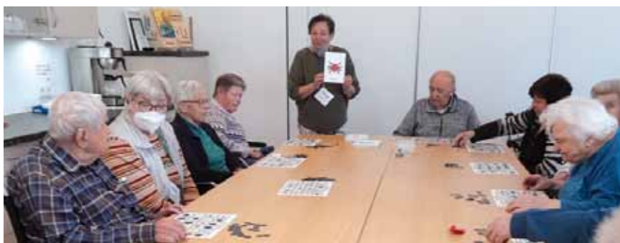
Ein Nachmittag mit Bingo-Spaß