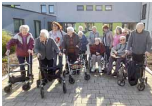
Herbstlicher Ausflug in Wendelstein