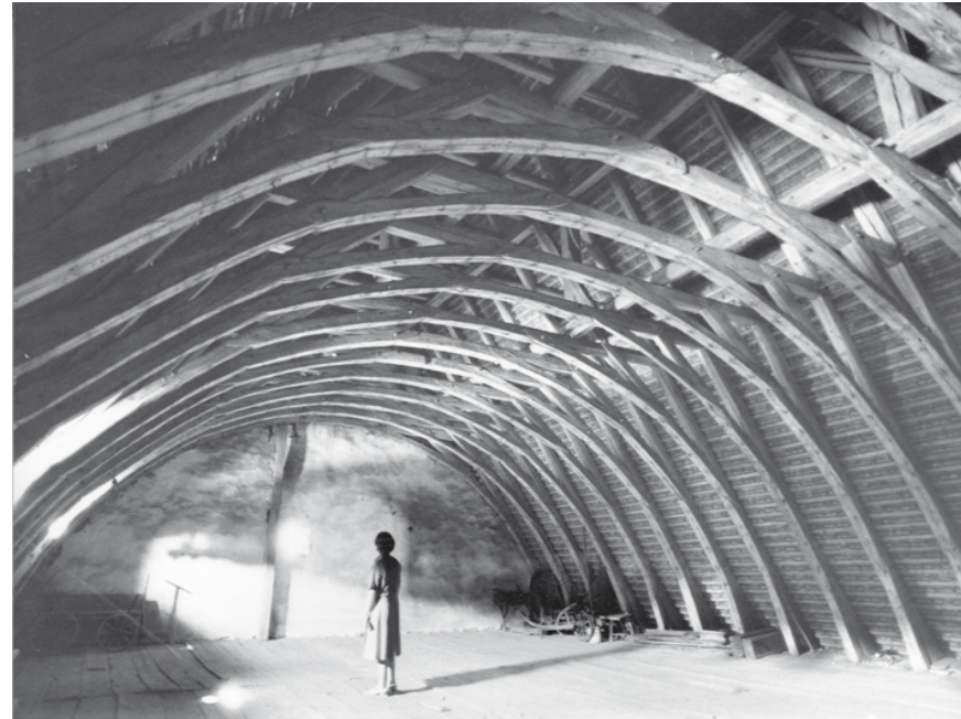
Allerheiligenkirche Gebälk Kirche, 1991

Um deren Umfang feststellen zu können, wurde der Turm deshalb in der Folge zunächst mit einer Drohne und später mit einem Hubsteiger befahren. Dabei wurden die Schäden bestätigt und eine genauere Untersuchung des Turms geplant. Der Aufwand ist deshalb nötig, weil der Turm noch weitgehend mit historischen Ziegeln gedeckt ist, die nicht so einfach abgehoben werden können. Also muss der Turm von innen begangen werden. Zunächst einmal aber fand im Anschluss eine umfangreiche Begehung der gesamten Kirche statt. Dabei wurden noch weitere kritische Entwicklungen festgestellt.